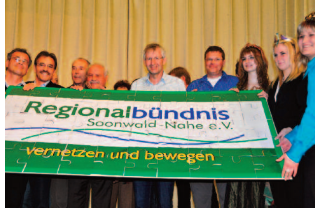
Ein breites Bündnis für die Soonahe-Region.