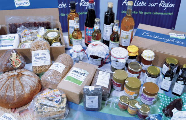
Idar-Oberstein im Mittelpunkt

Herzlich willkommen zu den „Tagen der Region 2010“