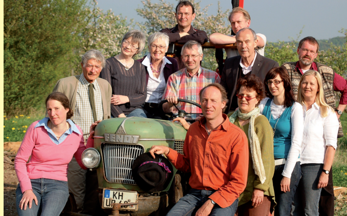
Veranstalter & Sponsoren