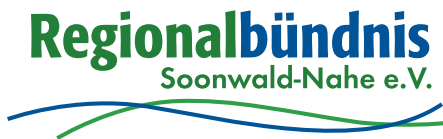
Gestaltung: B&D Design, Monzingen, www.bb-grafikdesign.de